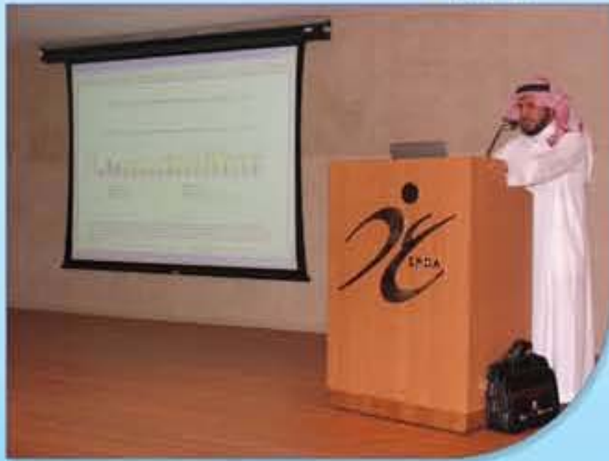
د. الحديثي خلال تقديمه المحاضرة

في إطار جهود قطاع الدواء التوعوية قام القطاع بتنظيم ندوة علمية عن ما يجب معرفته عن أنفلونزا AH1N1 حقائق ومخاوف، وذلك في القاعة الرئيسية بمبنى الهيئة والتي ألقاها سعادة الدكتور مقبل بن عبدالله الحديثي الأستاذ المشارك بكلية الطب بجامعة الملك سعود واستشاري الأمراض المعدية. شهدت المحاضرة حضوراً كثيفاً وتفاعلاً كبيراً من منسوبي الهيئة، حيث أجاب فيها المحاضر على أسئلة الحضور، وبعد انتهاء المحاضرة تم تسليم درع تكريمي للدكتور الحديثي تقديراً لجهوده في إنجاح المحاضرة.