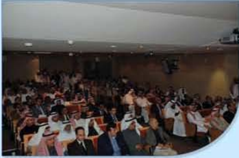
حضور كثيف لمندوبي الشركات الدوائية

من جهة أخرى تم تقديم عرض متكامل لكافة عناصر الأنظمة، وآلية التسجيل و التواصل الإلكتروني، و الإجابة على مختلف الاستفسارات في هذا المجال، جدير بالذكر أن الدعوة وجهت لجميع مصانع الأدوية الوطنية وشركات الأدوية و مكاتبها العلمية ووكلاء شركات الأدوية بالمملكة حيث حضر مايزيد عن 150 مندوباً عن المنشآت الصيدلانية في المملكة.